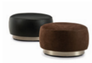
06 TORII BOLD POUF MEDIUM Ø CM 71 H41