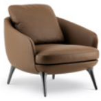
05 RAPHAEL POLTRONE LARGE CM 82X90 H78